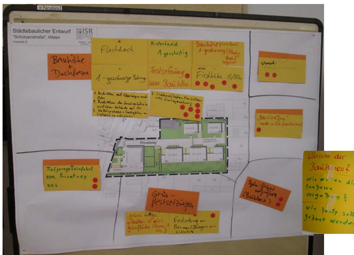
Abb. 4 Variante 5 mit den Optimierungsvorschlägen