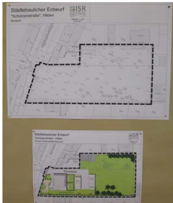
Abb. 1 Bestandsplan sowie Plan mit Bebauung ausschließlich entlang der Schützenstraße

Herr Groll erklärte den städtebaulichen Entwurf (Variante 5), erläuterte die geplanten Gelände- und Firsthöhen, und wies auf die Untersuchung der Schattenwirkung der Variante 5 hin.